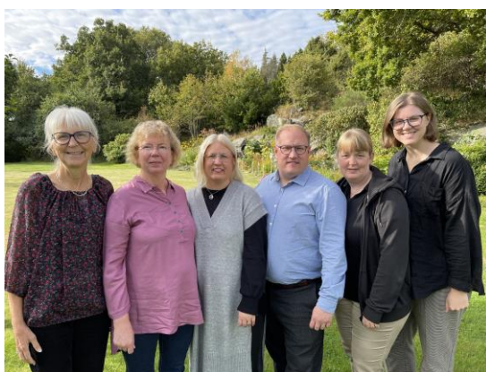
Nduguföreningens styrelse i september 2023