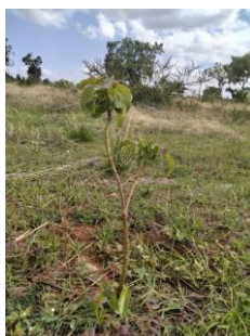
Ett av de nyplanterade träden vid Magugu Primary School