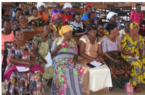
Seminarium om kvinnors ägande för såväl familjen som samhällets utveckling